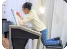
(上)YouTube 用の動画を撮影 中。(下)自宅 で作曲中の様子。

お 母様がヤマハ出身だった こともあり、おんがくな かよしコースからヤマハへ。幼 児科時代は、特に歌うのが好き だったそうで、そのまま今も在 籍しているJ専(*1)へ。 「エレクトーンは、音やリズム が組み込めるのが楽しい!」。 今は、エレクトーンの技術を 高めるために、ピアノの個人 レッスンも受けているそう。 YouTubeは、親子であげて いたInstagramを見ていた人か らの「もっと弾いているところ が見たい」というリクエストに 応じて2019年からスタート。 「私が楽しく演奏していると、 みんながほめてくれて、それが また次の曲もがんばるぞ!とい う気持ちにつながります」。