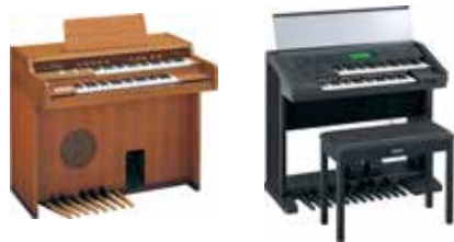
(右)1990年代に人気だった「EL-90」。 (左)初代のモデル「D-1」。

その語源はelectronicとtoneからきており、初代エレクトーンができたのは1959年。それは、国産で初のトランジスタを使用した「電子オルガン」の完成でした。その後、時代やユーザーのニーズにあわせて何度も改良され、近年では、様々な音色やリズム機能が搭載され、多彩な楽しみ方ができるよう。