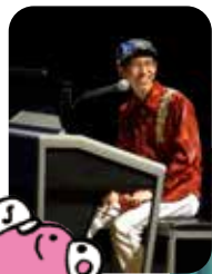
(左)受賞記念コ ンサートでの1コ マ。(下)幼児科 の頃のステージで。

お 母様がヤマハ出身だった こともあり、おんがくな かよしコースからヤマハへ。幼 児科時代は、特に歌うのが好き だったそうで、そのまま今も在 籍しているJ専(*1)へ。 「エレクトーンは、音やリズム が組み込めるのが楽しい!」。 今は、エレクトーンの技術を 高めるために、ピアノの個人 レッスンも受けているそう。 YouTubeは、親子であげて いたInstagramを見ていた人か らの「もっと弾いているところ が見たい」というリクエストに 応じて2019年からスタート。 「私が楽しく演奏していると、 みんながほめてくれて、それが また次の曲もがんばるぞ!とい う気持ちにつながります」。