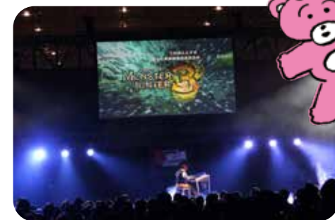
自身が作曲したゲーム音楽のイベント。

中3のときに、将来音楽の仕事をしたかと思いきや、音大を目指し、進学を果たします。「エレクトーンで音大に行きた