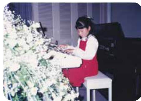
小3のときの発表会。