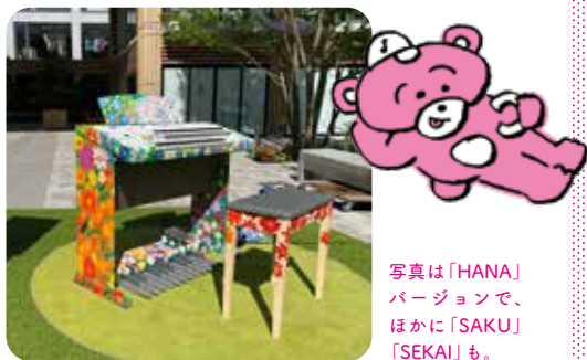
写真は「HANA」バージョンで、ほかに「SAKU」「SEKAI」も。

駅や街中においてあって誰もが自由に演奏を楽しめる、駅ピアノやストリートピアノのエレクトーン版が、「ストリートエレクトーン」。レッスンで使っているベーシックタイプがカラフルにペイントされ、現在は3台のエレクトーンが全国を旅しています。