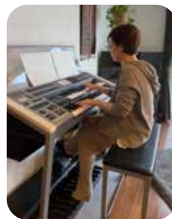
自宅リビングにて。今はエレクトーンはたまに弾く程度。

最近では、海外から作曲の仕事のオーダーが来ることも多いそう、「SNSでのフォローワーさんも海外の人が多くて、世界が広がっている感じがします。今後は、もっと自分の曲を聴いてもらえる機会を増やせたらいいなと思っています」。